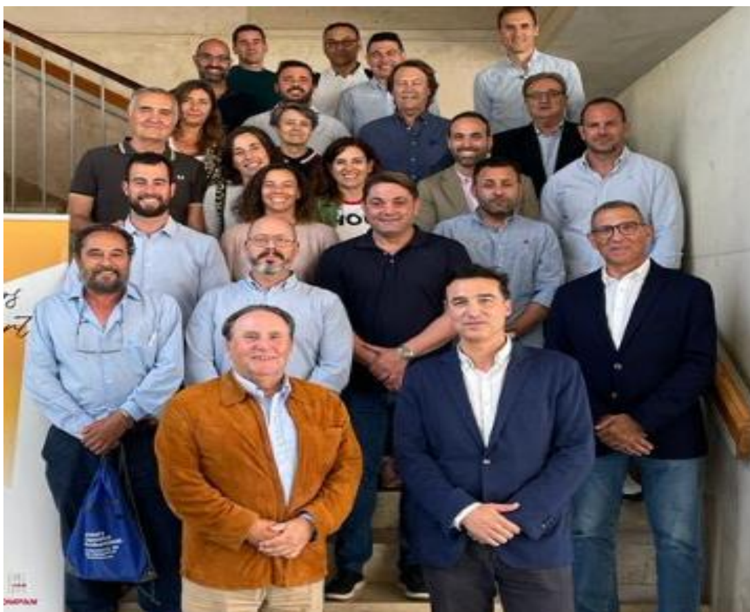
CREACIÓN DE LA COMISIÓN DE IGUALDAD